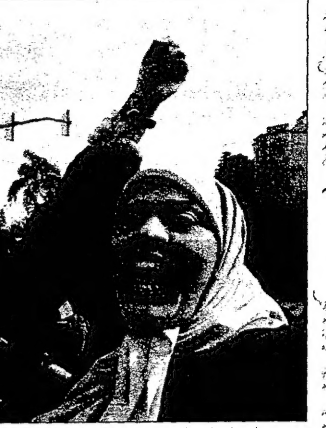
ثلاث جزائريات تظهرن اسن بالماسعة الجزائر احتجاجها على قانون العائلة ومالين بالقتل (رويتز)

الثلاث جزائريات تظهرن اسن بالماسعة الجزائر احتجاجها على قانون العائلة ومالين بالقتل (رويتز) الثلاث جزائريات تظهرن اسن بالماسعة الجزائر احتجاجها على قانون العائلة ومالين بالقتل (رويتز)